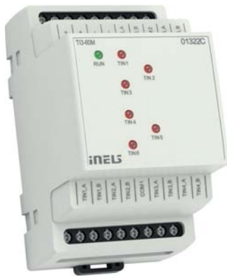
EAN kód TI3-60M: 8595188132893